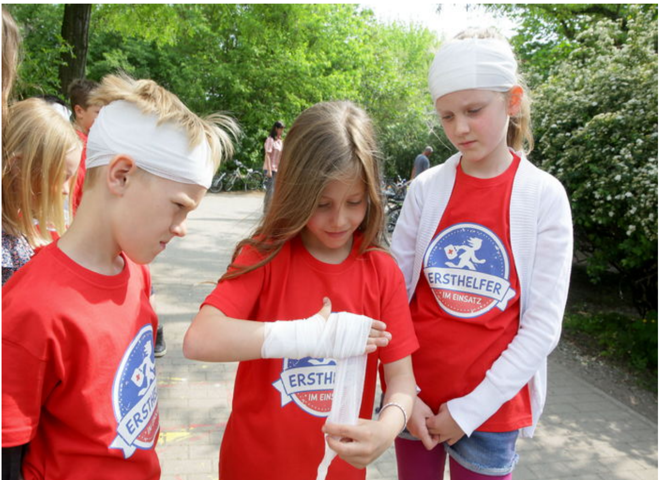
Einen Hand- oder Kopfverband legen unsere Juniorhelfer mit links an.

Erste Hilfe-Themen in der Grundschule bieten die Möglichkeit für nachhaltiges Lernen, das in vielen bedeutenden Kompetenzbereichen bei Schüler*innen zu positiven Effekten führt; so fördert es zum Beispiel die Zivilcourage und das Selbstbewusstsein der Kinder. Eine bereits in der Grundschule beginnende Heranführung an die Erste Hilfe kann die Entstehung von Hemmschwellen bei Hilfeleistungen frühzeitig verhindern.