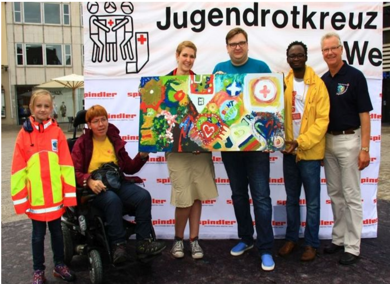
"Die Welt ist bunt!": Action Painting in Würzburg