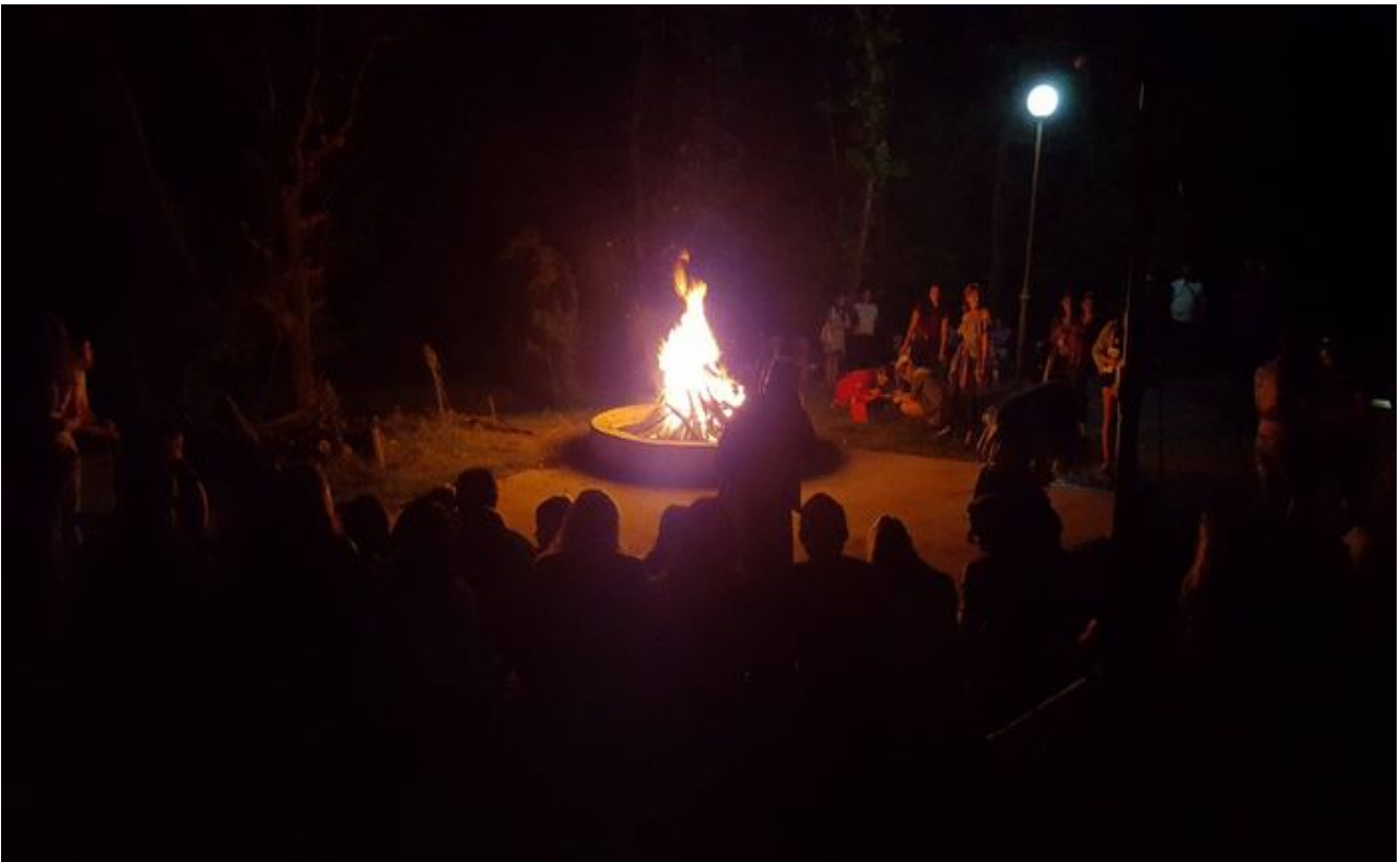
Lagerfeuerromantik am letzten Abend