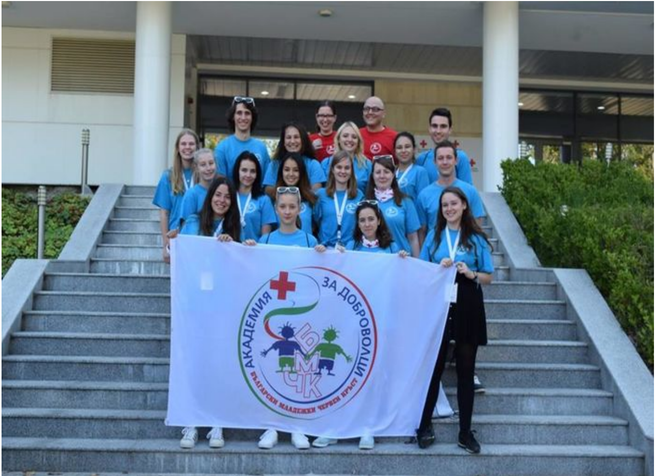
Die internationale Gruppe

Die unterschiedlichen Gruppen traten gemäß dem Akademiemotto „Challenge yourself“ gegeneinander an: Während der Akademietage wurden etliche individuell oder im Team zu lösende Aufgaben als QR-Code versteckt oder öffentlich angekündigt, sodass man bei erfolgreicher Bewältigung dieser „Challenges“ Punkte für die eigene Gruppe sammeln konnte.