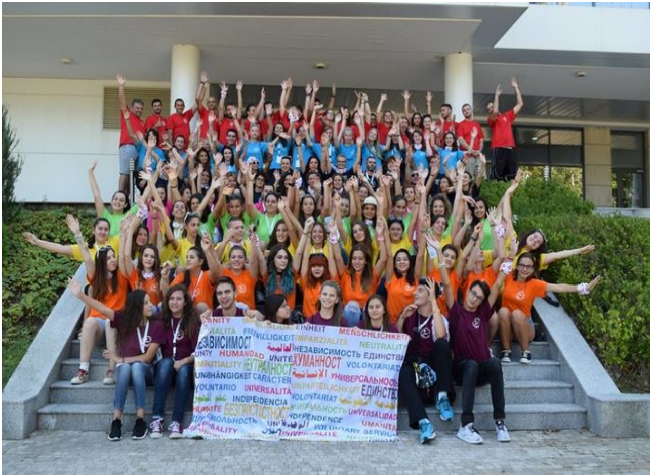
Kunterbunte Vielfalt bei den Teilnehmer*innen